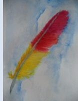
Peindre la nature