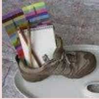
Marcher et créer en randoart