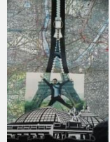
Achever sa peinture

les citations de promenade-artistique http://www.promenade-artistique.fr/#!citations/cjpc