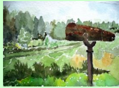
Voir, regarder, penser